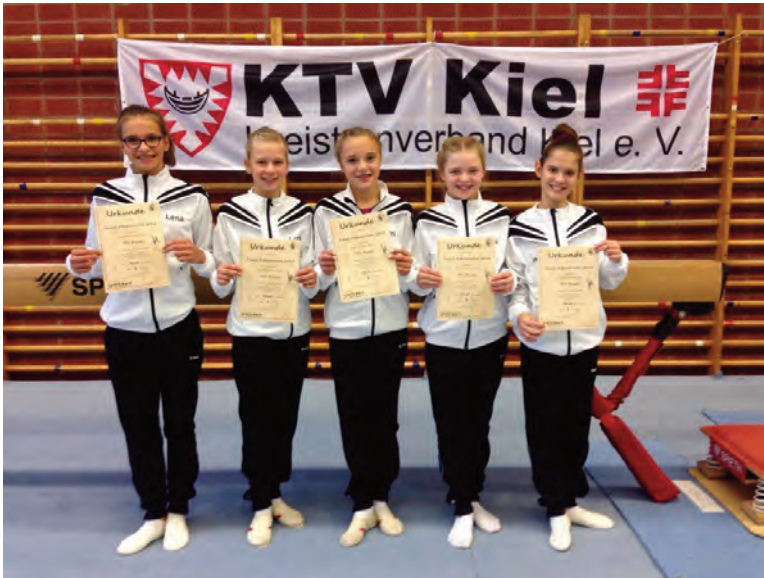
Kieler Pokal- turnen 2015